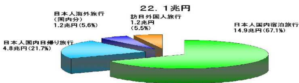
図 I-2-5-1 国内の旅行消費額22.1兆円の市場別内訳

我が国の平成21年度国内旅行消費額は22.1兆円であり、我が国経済にもたらす直接的な経済効果は、直接の付加価値誘発効果が11.0兆円（国内総生産（名目GDP）の2.3%）、雇用誘発効果が211万人（全就業者数の3.4%）と推計される。